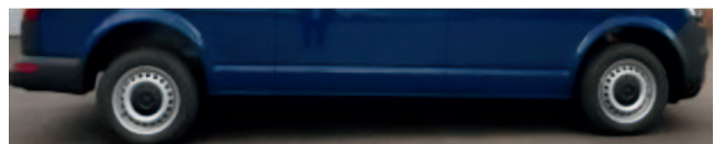
Fahrzeugoptik mit FWK unter max. Last 3.5t